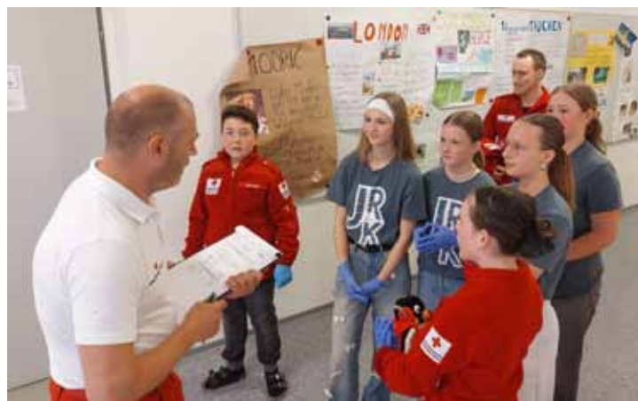
JRK Gruppe beim Bewerb

Eine besondere Veranstaltung war der JRK-Bewerb, der erstmals in Peilstein ausgetragen wurde. Unsere JRK-Gruppe erreichte dabei die Goldmedaille – ein großartiger Erfolg, auf den wir besonders stolz sind!