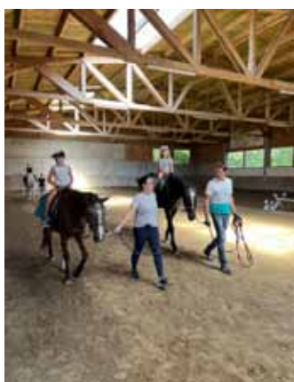
Erlebnistag am Ramlhof die Ferienaktion vom Elternverein

Kindertennis, Blaulichttag, Waldtag, Fischen, Fahrsicherheitstraining und Vier-Beiner-Nachmittag waren nur einige der Highlights, die wir in Zusammenarbeit mit den Nebelberger Vereinen anbieten konnten. Den gelungenen Abschluss bildete der Erlebnistag am Ramlhof, den wir selbst organisierten. Bei perfektem Wetter konnten die Kinder im Pool baden, die Hüpfburg nutzen, sich schminken lassen und natürlich in der Reithalle reiten – ein wunderbarer Tag für all unsere Schüler:innen.