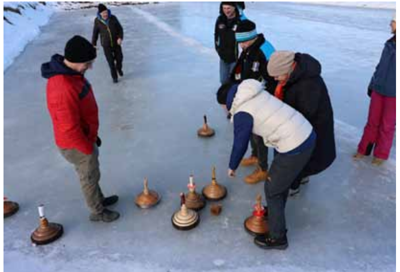
Eisstockschießen bei perfekten Verhältnissen am Jagateich

Die Sektion Stock freut sich schon jetzt auf viele motivierte Schützen auf dem Eis und wünscht ein kräftiges „Stock Heil!“