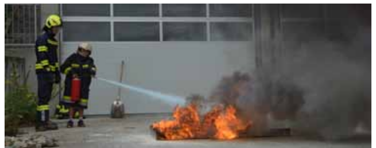
Blaulichttag - Ferienspiel