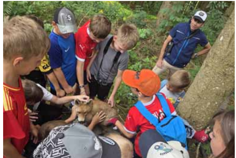
Spiel & Spaß im Wald