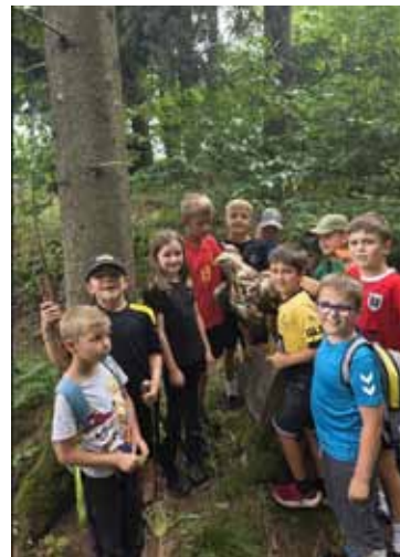
Spiel & Spaß im Wald