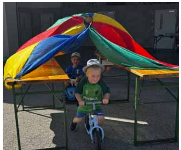
Ferienprogramm 2025 - Fahrsicherheitstraining für die Jüngsten