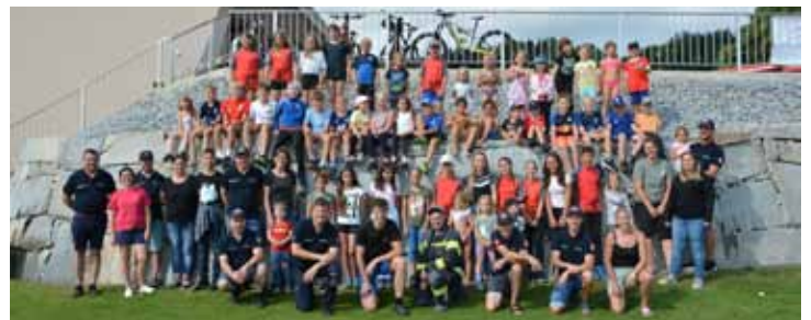
Blaulichttag - Ferienspiel