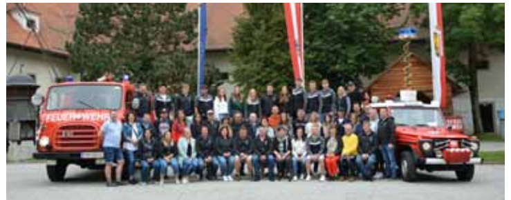
Feuerwehorausflug Feuerwehrmuseum St. Florian