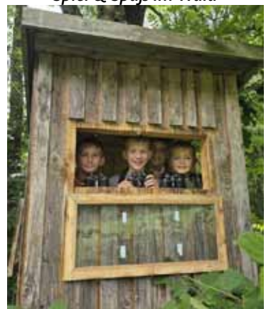
Spiel & Spaß im Wald