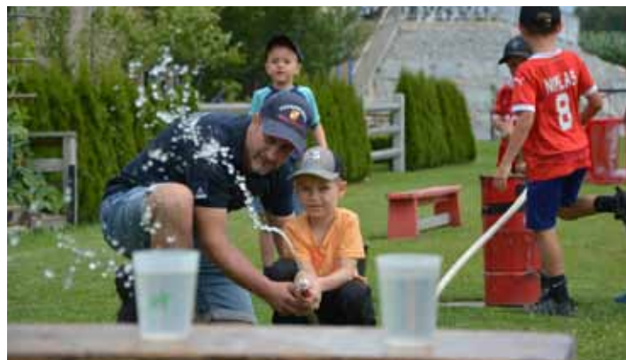
Blaulichttag der FF