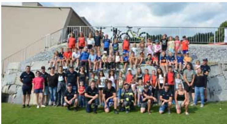
Blaulichttag der FF