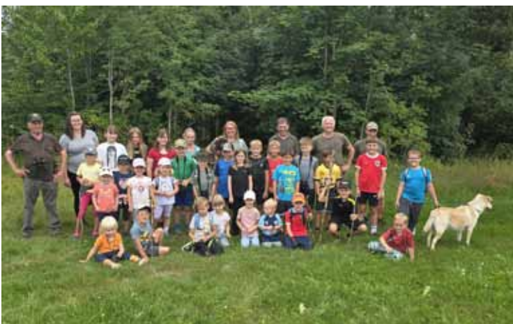
Spiel & Spaß im Wald