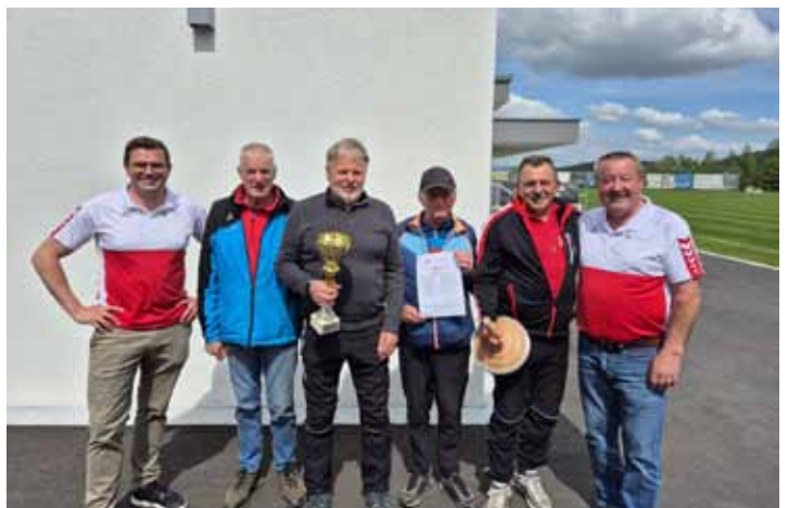
1. Rang beim Stockturnier der SPÖ Kollerschlag

am Podest. Zu dieser beeindruckenden Serie kann man nur herzlich gratulieren und hoffen, dass sie im kommenden Jahr genauso weitergeht.