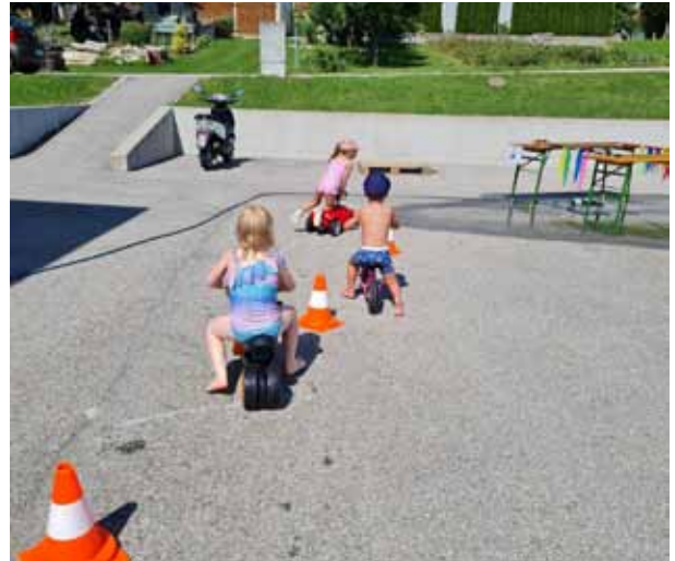
Ferienprogramm 2025 - Fahrsicherheitstraining für die Jüngsten

Auch heuer beteiligten wir uns wieder beim Ferienspiel des Elternvereins Heinrichsberg und organisierten ein „Fahrsicherheitstraining“ für unsere Kleinen. Mit den unterschiedlichsten Gefährten wurde unser Parcours passiert und so eine sichere