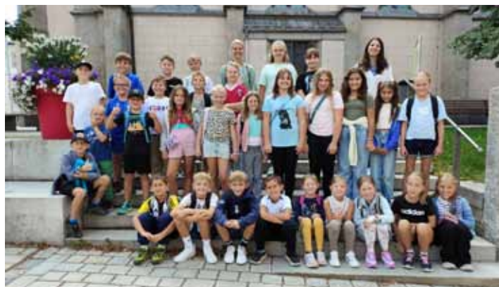
Kinofahrt der Gemeinde