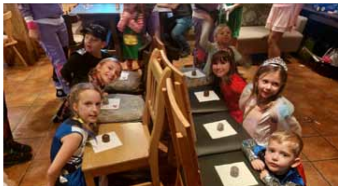
Kinderfasching im Gasthaus Ramlhof