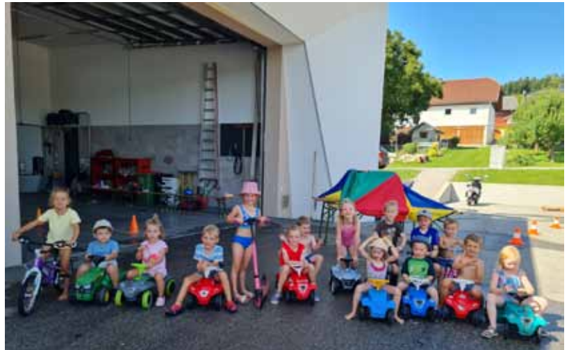
Ferienprogramm 2025 - Fahrsicherheitstraining für die Jüngsten