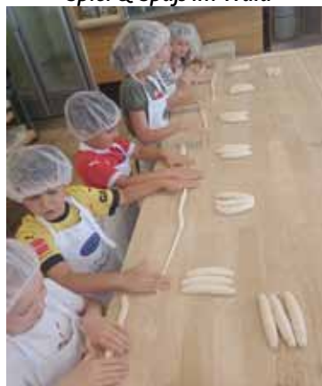
Backerlebnis am Mauracherhof