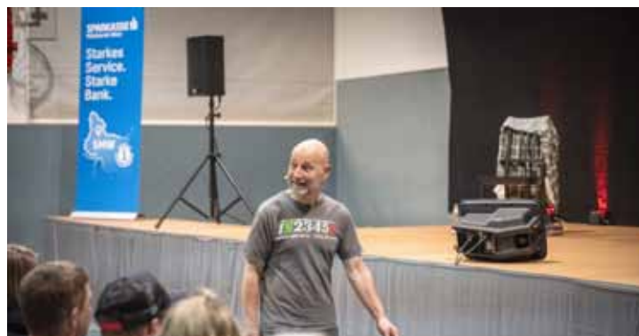
Roland Düringer in Peilstein