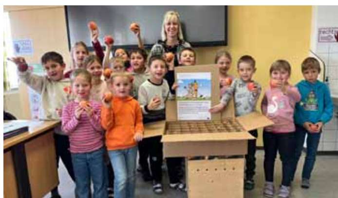
Erste Bio-Äpfel-Lieferung für die Schule

Wir sind bereits voller Vorfreude auf das Jahr 2026, bei dem wir neben dem Kinderfasching auch wieder ein Ferienprogramm für die Nebelberger Kinder machen möchten. Dafür möchten wir uns jetzt schon bei allen bedanken, die uns unterstützen.