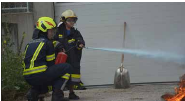
Blaulichttag der FF