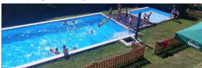
Erlebnistag am Ramlhof die Ferienaktion vom Elternverein

Noch bevor die Kinder an den vielen tollen Aktionen des Ferienprogramms teilnehmen konnten, fand das Schulfest unserer Volksschule statt. Auch diesmal übernahmen wir die Bewirtung – und unser Verkaufsstand lockte mit erfrischenden Melonen. Das Wetter zeigte sich von seiner besten Seite, und die Schüler:innen präsentierten gemeinsam mit ihren Lehrkräften großartige Darbietungen, die einem gelungenen Abschluss würdig waren.