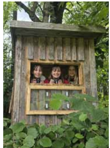
Spiel & Spaß im Wald