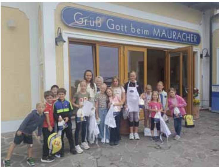
Backerlebnis am Mauracherhof