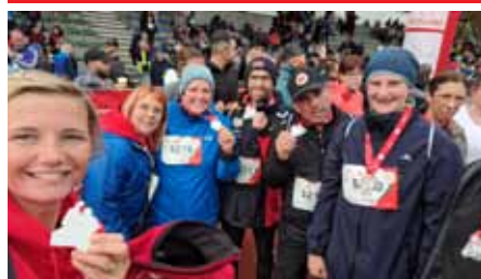
...Teilnahme beim Herzlauf in Traun