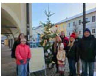
...beim SPÖ-Weihnachtsbaum aufstellen am Stadtplatz