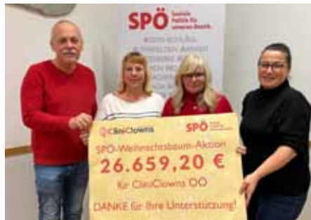
Jährlich steht der SPÖ-Weihnachtsbaum am Stadtplatz, um Spenden für den guten Zweck zu sammeln. Heuer ging der Erlös an die CliniClowns OÖ - danke an alle SpenderInnen