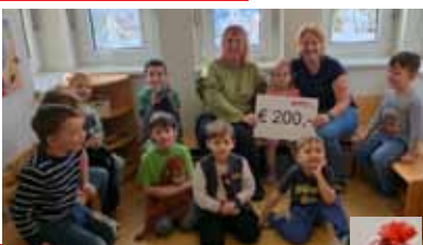
...unterwegs in den Kindergärten, um am Tag der Bildung, 24.1. DANKE an alle ElementarpädagogInnen zu sagen & um Spenden von jeweils € 200,- für unsere Kindergärten zu überreichen, die am Berger Kirtag gesammelt wurden.