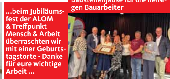
...beim Jubiläumsfest der ALOM & Treffpunkt Mensch & Arbeit überraschten wir mit einer Geburtstagstorte - Danke für eure wichtige Arbeit ...

Einen schönen Sommer & schöne Tage mit euren Lieben