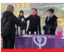
...SJ Punschstand zugunsten de Frauen- und Familiennetzwerk Rohrbach.