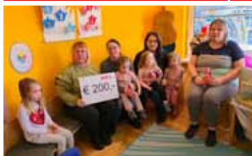
...unterwegs in den Kindergärten, um am Tag der Bildung, 24.1. DANKE an alle ElementarpädagogInnen zu sagen & um Spenden von jeweils € 200,- für unsere Kindergärten zu überreichen, die am Berger Kirtag gesammelt wurden.