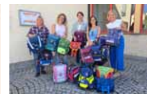
Schultaschensammelaktion & Übergaben an Volkshilfe