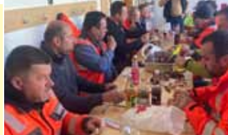
Baustellenjause für die fleißigen Bauarbeiter