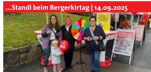
...dreh am Glücksrad und gewinne! Die Gewinnerinnen freuten sich über Hallenbad-Eintritte