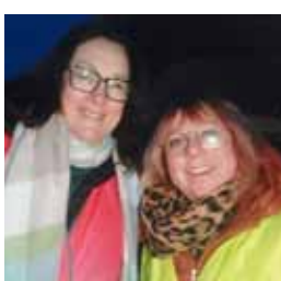
...beim Frühstückspfeifen verteilen für PendlerInnen