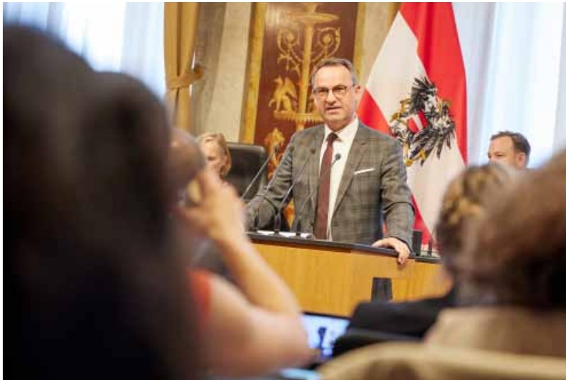
„Gemeinden schaffen den Lebensraum für unsere BürgerInnen. Das Kaputtsparen hat fatale Folgen für jede und jeden. Es ist Zeit zu handeln!“

Gleichzeitig zeigt ein Bericht des Landesrechnungshofs ein strukturelles Ungleichgewicht: Die Gemeinden zahl-