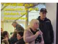
...beim Frühschoppen der FF Rohrbach - ein Fass Bier für die FF-KameradInnen. Danke für euren Einsatz!