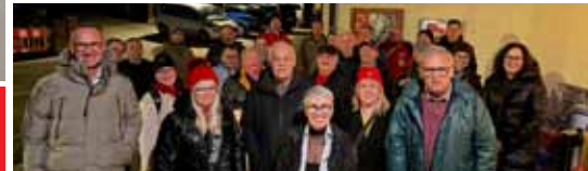
Benefizpunsch & Kekseaktion zum Spenden sammeln für ARCUS, MIKADO-Beratungsstellen | € 900,- konnten an ARCUS überreicht werden